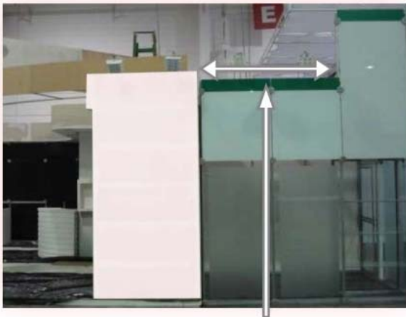
EXEMPLO DE RECULO